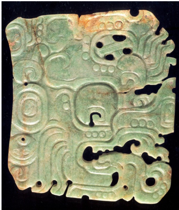
Placa de jadeíta, Petén, Guatemala, 250-900 d.C., 9.5 x 8.5 cm