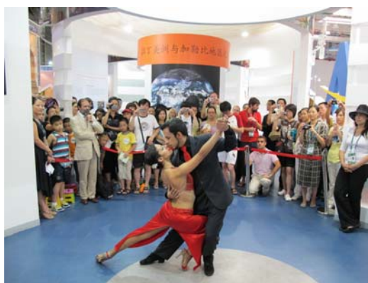
Animación de tango por bailarines argentinos en el Pabellón del ICOM W. Liu © ICOM

En julio, los animadores canadienses del CECA (Comité internacional del ICOM para la educación y la acción cultural) han propuesto una serie de actividades en las cuales la fauna, la flora y los objetos arqueológicos de América del Norte fueron presentados a los visitantes, además de organizar un taller de fabricación de pulseras tradicionales de los Amerindios, una animación "Viaje en casa de los Esquimales" y una degustación de jarabe de arce.