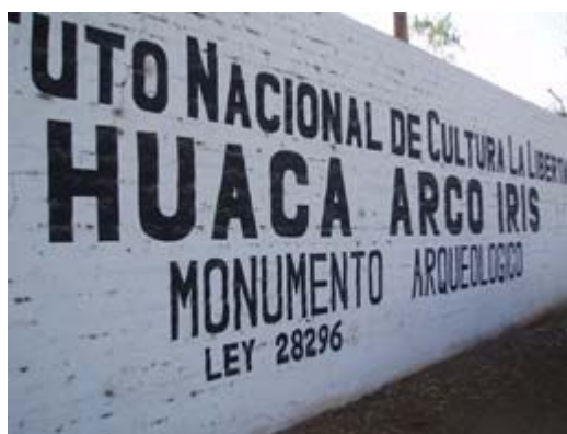
Muro perimétrico de la huaca El Dragón que fue depredado despiadadamente a principios de 2010.

El pasado 24 de marzo se inició en Perú una campaña nacional de concienciación sobre el tema de la lucha contra el tráfico ilícito de bienes culturales. La campaña se compone de siete cuñas radiofónicas de treinta segundos emitidas treinta veces al día a nivel nacional en la frecuencia modulada 103.9 y también por Internet ( www.radionacional.com.pe ). Además, se presentarán cinco cuñas televisivas en mayo, que se celebrará en Perú como “Mes de los Museos”.